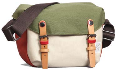
Z4969 G Cetus パインメープル