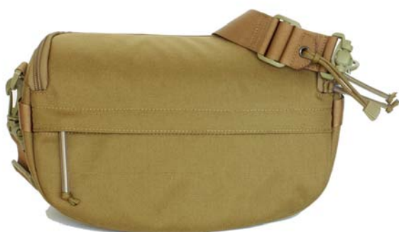
コヨーテブラウン