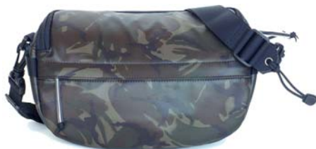
ブリティッシュアーバン