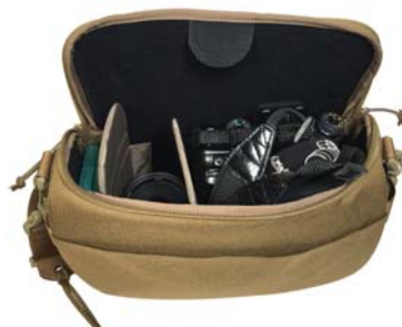
収納イメージ(内容物は付属しません。)